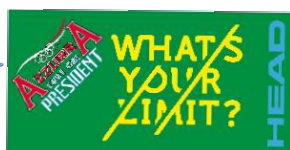
Telo - RIO